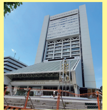
現在の中野サンプラザ