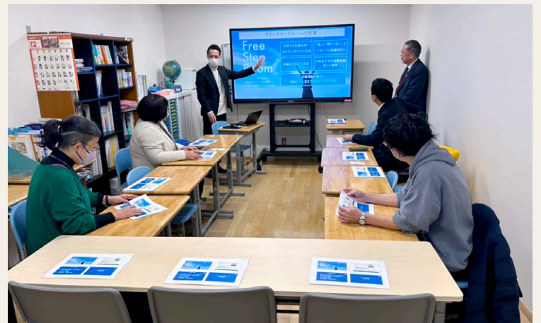
フリーステップルームの取り組みについて説明を受ける区議団

これまでの学習支援に加え、児童・生徒の興味関心に応じた体験活動や校外学習を行い、利用者が大きく増えています。現地では、子どもたちが楽しそうに思い思いの時間を過ごしている様子を見させていただき、なくてはならない居場所となっていることを感じました。