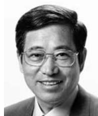
都議会議員 植木こうじ