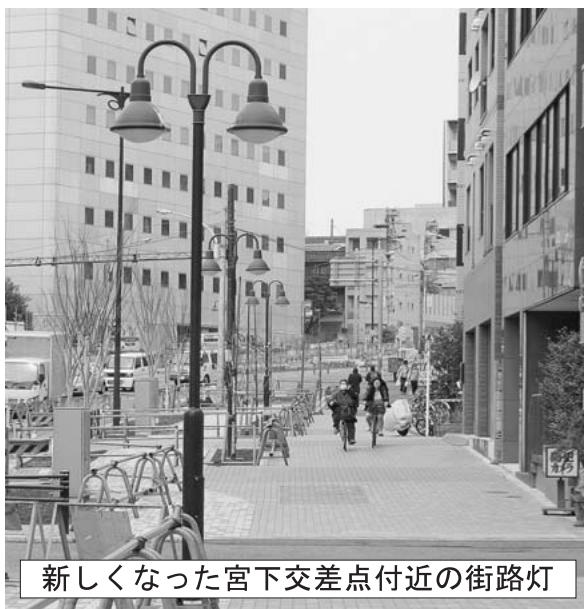
新しくなった宮下交差点付近の街路灯

山手通り工事完成後の8ヶ所に街路灯を環境にやさしく 180本の太陽光パネルを 活用する 1ヶ所を と来住和 行は議会で要求しました。